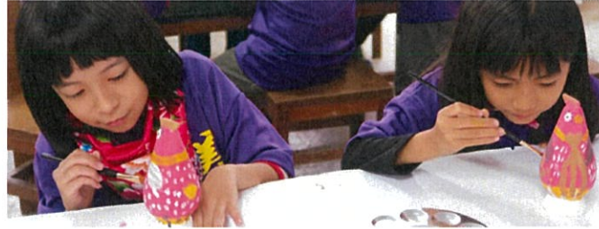
弱勢美感學 勸導計畫

台灣區域經濟發展不均造成教育資源分配不均，造成弱勢學童學習發展受阻，在多元入學的同時逐漸失去競爭力，造成對「創造力教育」的自覺，提出「弱勢美感學」協助學童資源不足，創造力課程的實踐困難。